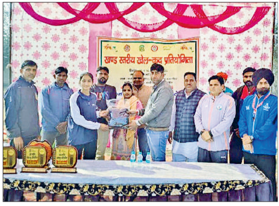
फतेहाबाद। ब्लॉक स्तरीय प्रतियोगिताओं में विजेता खिलाड़ियों को सम्मानित करते अतिथिगण।

खिलाड़ियों ने खेल भावना, अनुशासन और टीम वर्क का उत्कृष्ट प्रदर्शन किया