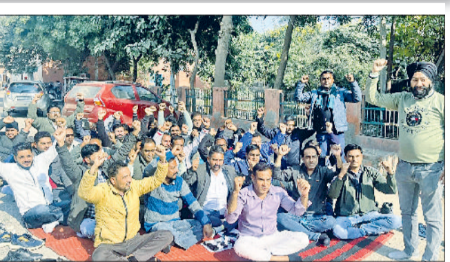
भद्रुकला। ऑनलाइन ट्रांसफर पॉलिसी का विरोध करते बिजली कर्मचारी तथा सिरसा में ऑनलाइन ट्रांसफर पॉलिसी का विरोध जताते कर्मचारी।

वर्तमान स्वरूप में लागू की गई तो इसमें विभागीय कार्यकुशलता, कर्मचारियों की सुरक्षा, मनोबल और उपभोक्ताओं को मिलने वाली सेवाओं सभी पर गहरा प्रतिकूल प्रभाव पड़ेगा। नए कार्य स्थल पर लाइन रूट एवं क्षेत्रीय परिस्थितियों की अपर्याप्त जानकारी के कारण हदसों व जानलेवा दुर्घटनाओं की संभावना अत्यधिक बढ़ जाएगी। क्षेत्र की जनकारी न होने के कारण कर्मचारियों को डिफॉल्ट राशि की वसूली, बिजली चोरी की रोकथाम तथा नए कनेक्शन की साइट वेरिफिकेशन जैसे कार्यों में गंभीर कठिनाइयां आएंगी। लाइन फाल्ट लोकेशन एवं ब्रेकडाउन अटेंड करने में क्षेत्रीय जानकारी के अभाव के कारण नए कर्मचारियों को