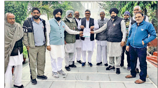
फतेहाबाद। विधायक को मांग पर सौंपते किसान मजदूर संघर्ष मोर्चा का प्रतिनिधिमंडल।