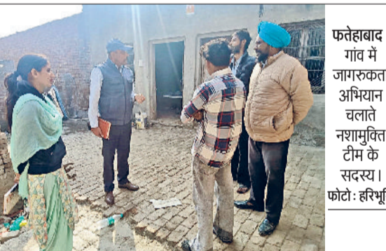
फतेहाबाद। गांव में जागरूकता अभियान चलाते नरामुक्ति टीम के सदस्य।

यहां पहुंचने पर इनेलो जिलाध्यक्ष बीकर सिंह हड़ौली के नेतृत्व में कार्यक्रमों में उनका स्वागत किया। इस दौरान इनसे के प्रदेशाध्यक्ष साहिलदीप कर्खा समेत कई पदाधिकारी मौजूद रहे। अर्जुन चौटाला ने कहा कि पूर्व मुख्यमंत्री स्व. चौधरी ओमप्रकाश चौटाला की प्रथम पुण्यतिथि पर 20 दिसंबर को