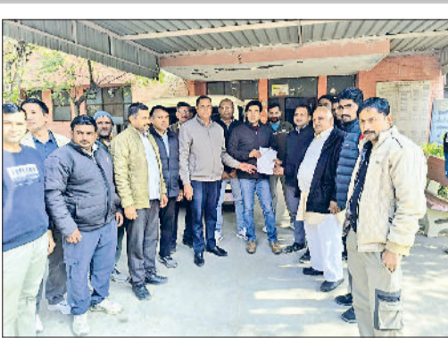
भद्रुकला। ऑनलाइन ट्रांसफर पॉलिसी का विरोध करते बिजली कर्मचारी तथा सिरसा में ऑनलाइन ट्रांसफर पॉलिसी का विरोध जताते कर्मचारी।